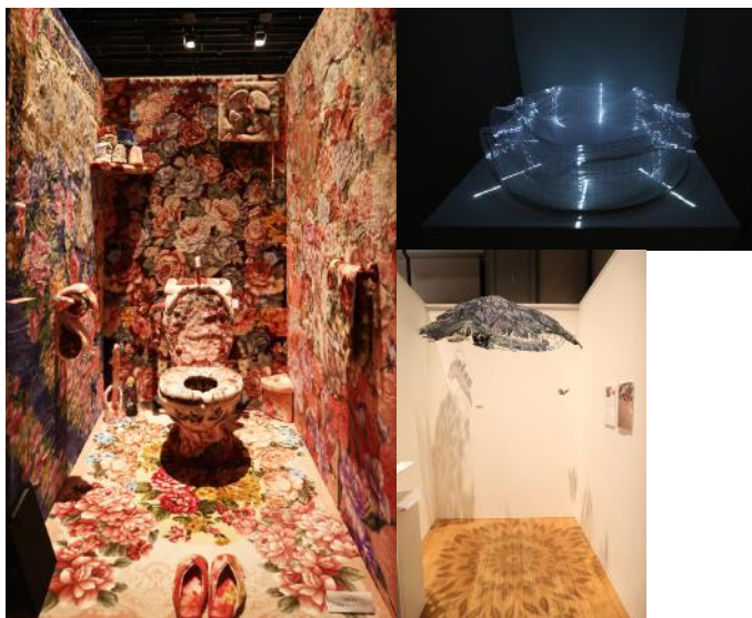
(左)「SICF17」グランプリ受賞作 江頭誠『お花畑』 (右上)「SICF17」準グランプリ・オーディエンス賞受賞作 後藤映則『toki-BALLET#1』 (右下)「SICF17」準グランプリ作 高木あすか『私の山 あなたの山』

江頭誠 (グランプリ) 後藤映則 (準グランプリ・オーディエンス賞) 高木あすか (準グランプリ) FUKUPOLY (岡本美津子賞) 江藤友理子 (金森香賞) 橋本美和子 (木村絵理子賞) MIWAKAKUTA (栗栖良依賞) 植松京子 (張熹賞) 山内沙也果 (スパイラル奨励賞)