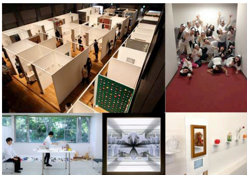
（左上）「SICF18」会場風景（右上）「SICF19 PLAY」I日程 劇団子供巨人 作品 （左下）「SICF19 EXHIBITION」A日程 藤中康輝/板倉諄哉/金森由晃 作品（中下）「SICF19 EXHIBITION」B日程 堀 康史 作品 （右下）「SICF19 EXHIBITION」C日程 Toshiya Yui + Atsuya Suzuki (Hashida Lab, Waseda Univ.) 作品

スパイラルは、若手クリエイターの発掘・育成・支援を目的としたゴールデンウィーク恒例のアートフェスティバル「SICF19」（第19回スパイラル・インディペンデント・クリエイターズ・フェスティバル）を2018年4月29日（日・祝）—5月6日（日）に開催します。