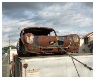
東城信之介 出展予定作品 『Su-pa-ca』