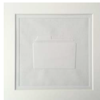
西井保奈美 『untitled folder』

出展者 ：西井保奈美（SICF17 出展者） 関川航平（SICF18 PLAY 最優秀賞） 下村優介（SICF18 出展者） Kamihasaki（SICF18 出展者） ※4月23日（月）より出展。