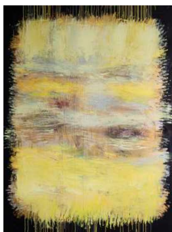
《Light Wins》(2016) Acryl, pigments, lava and gold leaf on canvas. 200 x 150 cm