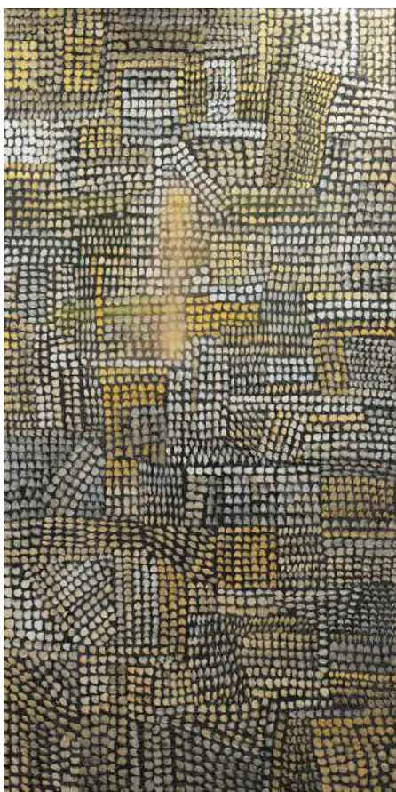
《Tokyo-series: Spell》(2018) Acryl, pigments, lava and gold leaf on canvas. 200 x 100 cm