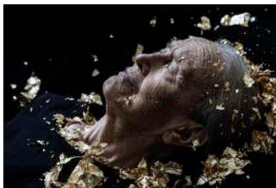
《Helmiriitta》(2016) Photograph 40 x 60 cm