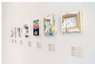
前田エマ参考作品

会場で展示する、出展者による「OUR GIFT」をテーマにセレクトをしたアイテムについてのエピソードやコメントの一部をご紹介します。