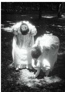
Olive 姉妹クリエイター

Web Site : https://www.opnner.com Instagram : @poxn Twitter : @opnner