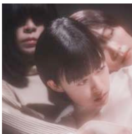
羊文学『POWERS』ジャケット

私たちが新しく作ったアルバム『POWERS』のテーマは「お守り」。それから派生してお守りのようにそばに置いたり、大切な人にプレゼントしたりして、小さな幸せを届けることができるようなものを選びました。手に取る人の毎日の暮らしがほんの少しでもハッピーになりますように。