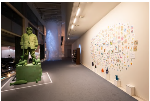
SICF23 EXHIBITION 部門 受賞者展

各部門のグランプリアーティスト展の会期中には、受賞者による展示も同時開催します。