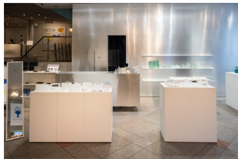
SICF23 MARKET 部門 受賞者展