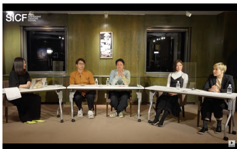
SICF24 EXHIBITION 部門 講評会