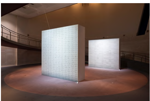
SICF22 EXHIBITION 部門 グランプリアーティスト展 チャンジンウェン「記憶容器」