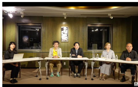
SICF24 MARKET 部門 講評会

※ 会期終了後、1 週間後を目安に YouTube チャンネル（jpSPIRAL）より講評会を配信する予定です。