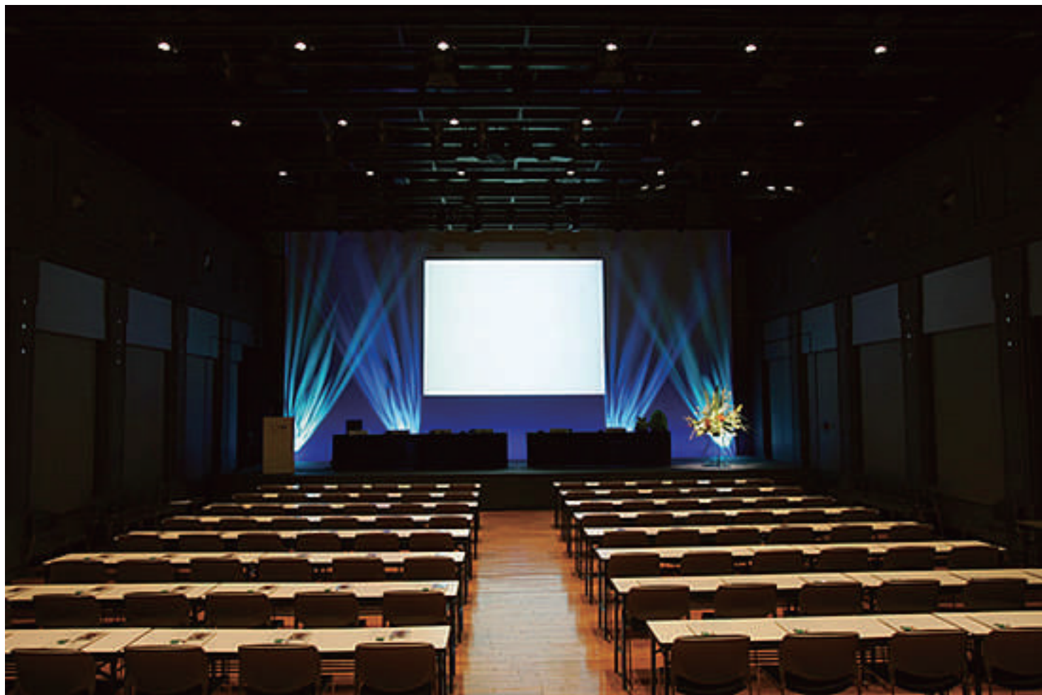
「プレスカンファレンス」レイアウト例 "press conference" layout example