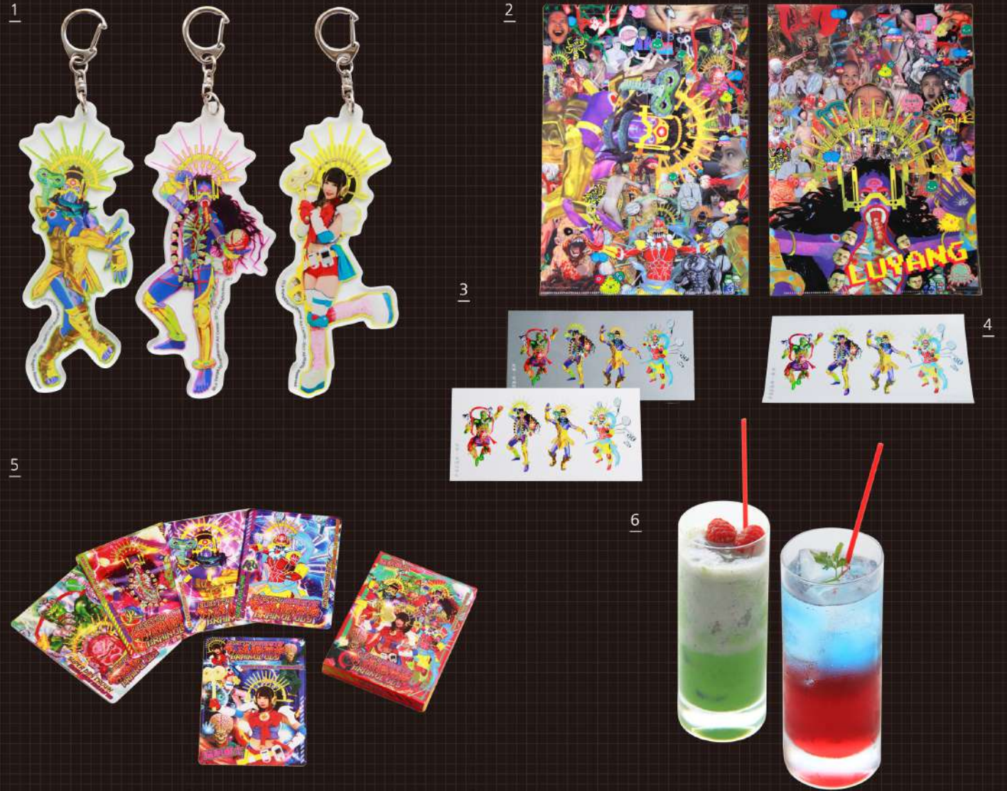
1. キーホルダー（3種） 2. クリアファイル 3. フライヤー 4. ステッカー 5. カードゲーム 6. スパイラルカフェ連動メニュー（左：地神スムージー、右：風神ソーダ）