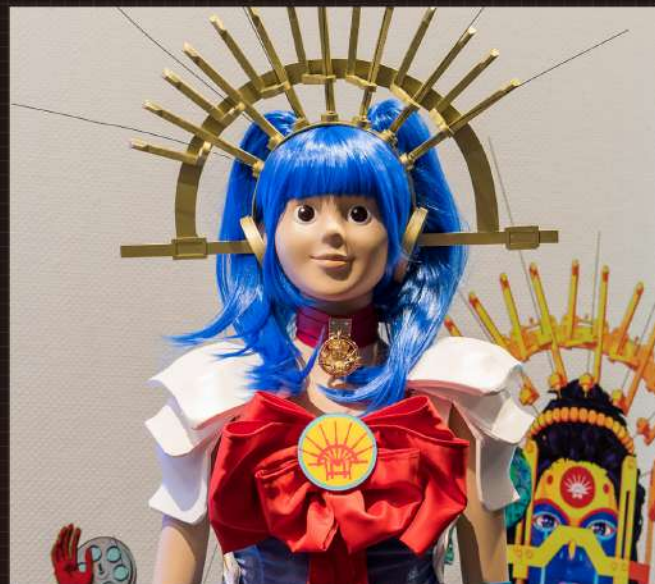
《電磁脳神教 — 脳制御士》コスチューム (chappie着用) Electromagnetic Blainology — Brain Control Messenger Costume with Chappie