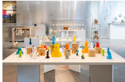
SICF25 MARKET 部門 受賞者展