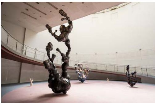
SICF24 EXHIBITION 部門 グランプリアーティスト展 クニト 「焼成隕石」