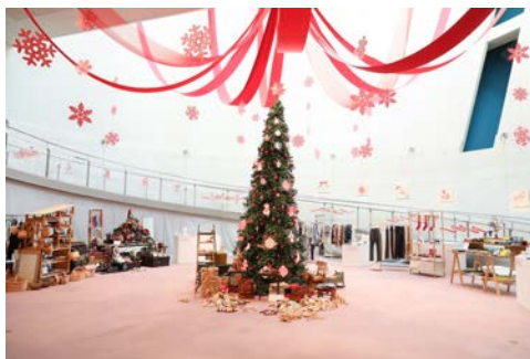
Spiral Xmas Market 2024 会場風景

SICF で出会ったクリエイターを、受賞の有無を問わず、スパイラルの館内外の各事業に積極的に起用し、作家との共存共栄関係の構築に取り組んでいます。