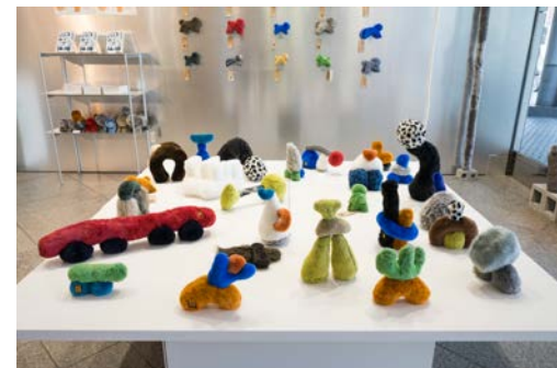
SICF24 MARKET 部門 グランプリアーティスト展 ARADOMO 「series」