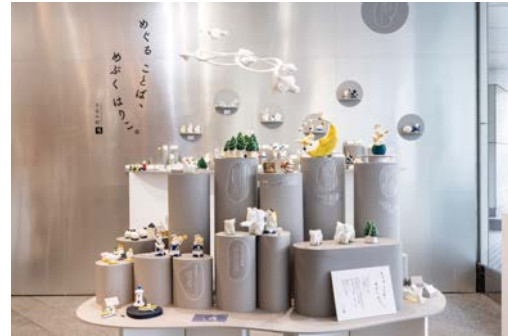
SICF25 MARKET 部門 グランプリアーティスト展 りなの村「めぐる ことば、めぶく はりこ。」