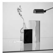
PART1 出展作品イメージ (一部)

■PART 2 会期：2025 年 12 月 12 日（金） - 16 日（火） 会場：スパイラルガーデン（スパイラル 1F）