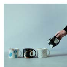
PART2 出展作品イメージ (一部)