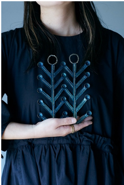
UMIOTO (tsun tsun poco poco)