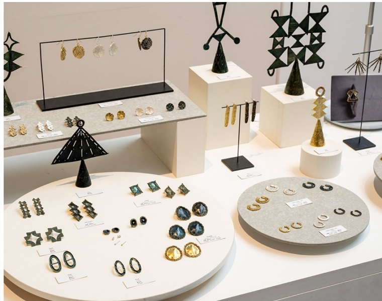
SICF26 MARKET 部門 会場風景