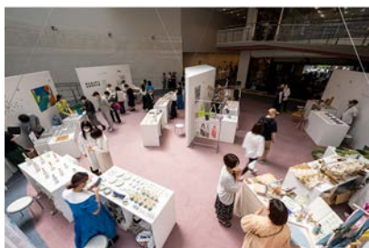
MARKET部門 会場風景