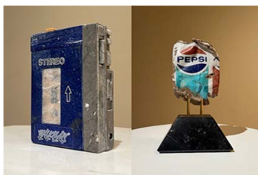
EXHIBITION 部門 A 日程 水巻純