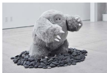
MARKET 部門 B 日程 表行 作品