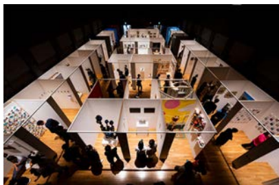
EXHIBITION部門 会場風景