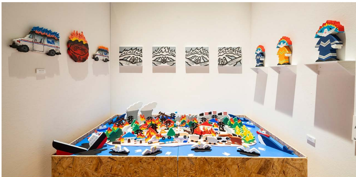
DAISUKE SAWAI (Landscape of Contemporary Civilization) SICF26 EXHIBITION 部門 グランプリ受賞作品